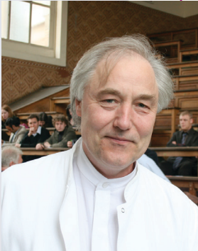
Hervé This Tous droits réservés.

Rencontre avec Hervé This (Groupe de Gastronomie moléculaire, Laboratoire de chimie analytique, UMR 1145 Ingénierie Procédés Aliment GENIAL), animée par Dominique Barnichon.