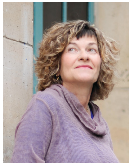
Maryline Desbiolles

Pierre Popovic : "Le commissaire se met à table". Table ronde animée par Alain Tissut.