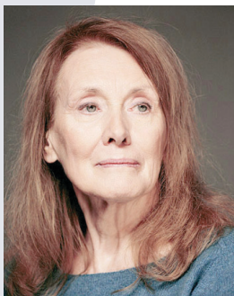
Annie Ernaux