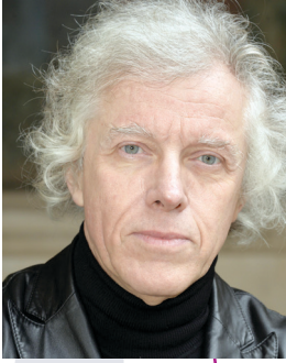
Pascal Ory