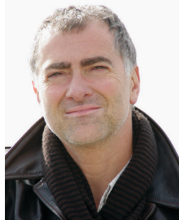
Pascal Taranto. Tous droits réservés.