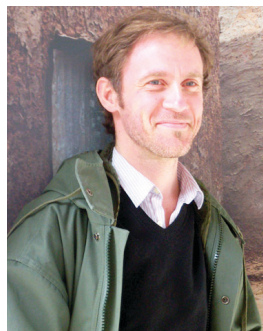
Arno Bertina