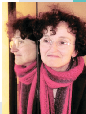
Marie-Hélène Lafon